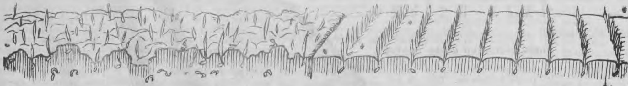
Быны кизем му.

ТИНЬ, УДМУРТ'ЕС. АГРОНОМЛЭН АЗВЕСЬ КАЛЫЗ ГИНЭ МАШИНАЕН КИЗЬЫНЫ УГ ВАЛЭКТЫ, КРЕСЯНЛЭН ЗАРНИ УЖЕЗ НО СОЕ ВОЗЬМАТЭ.