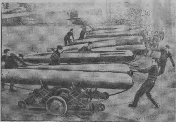
Англиэн Военно-Воздушной нужым'ёсыз.

Англиской аэродром'ёсын торпед'ёсты самолет'ёс доры нуллон.