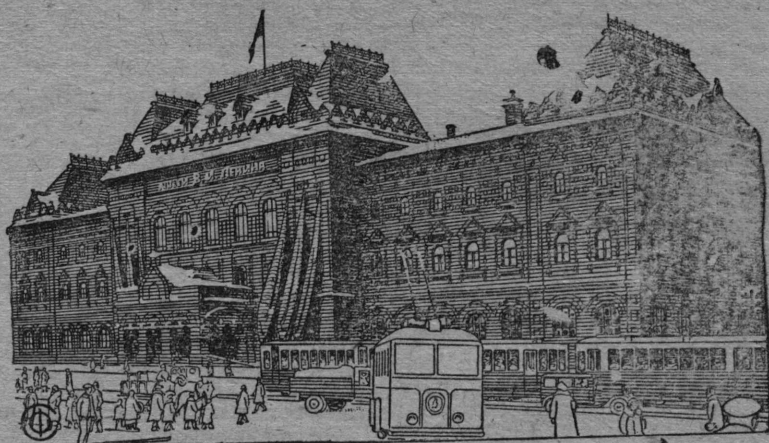
Здание музея В. И. Ленина на площади Революции в Москве.