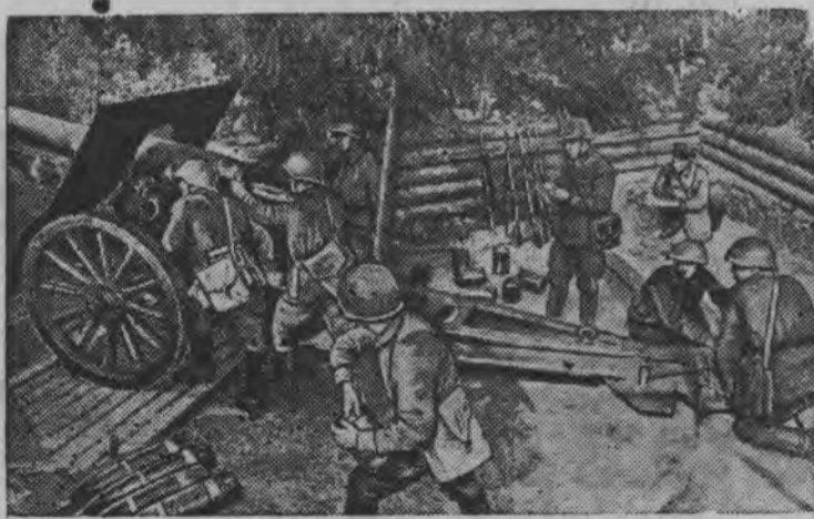
Артиллерист'ёс тушмон'ёсты ыбыло. ТАСС-лэн Фотоез.