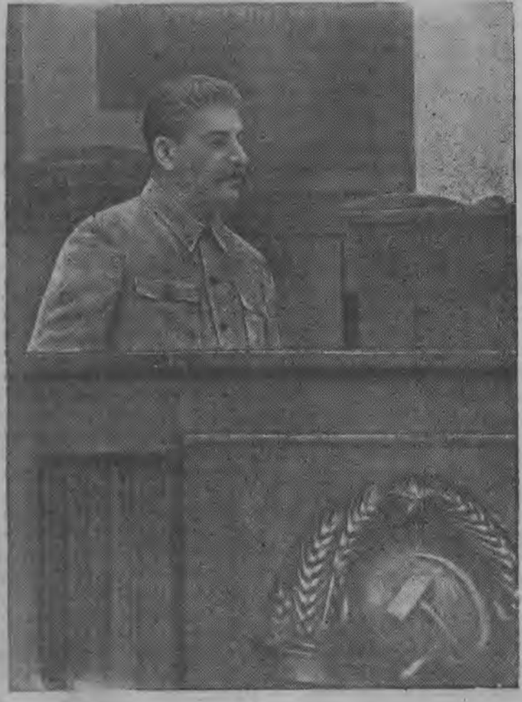
5 мае 1941 арын военной академиосты окончить карем командир'эслэн выпусксылы сйзем торжественной собранин.

ВКП(б)-лэн М-Пургияской Райкомезлэн но Райссветлэн органы. (Адрес: с. М-Пурга, УАССР)