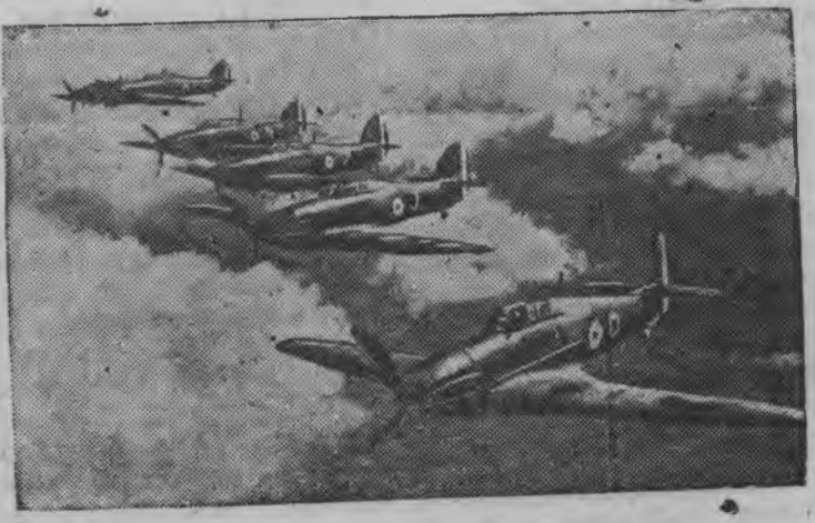
Английской бомбардировщик'эс лобзонны.

зы австралийской летчик'эс пöльсь, куд'эсыз дасяськызы Канадаын британской военно-воздушной кужым'эслы летной состав дасян имперской план'я. Сф рмировать каремын луозы истребительной бомбардировочной, штурмовой но разведывательной авиационлэн эскадриллиосыз.