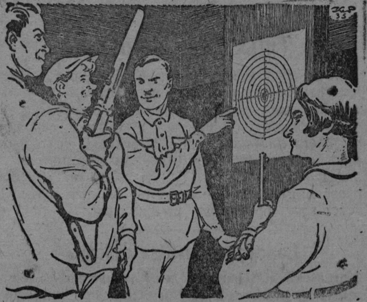
— Попадание отличное! Такую точку мы поставим на всяком покушении на нашу родину.