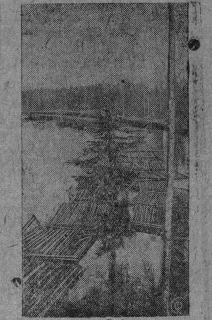
Vər kьlətəm kama vьlьn