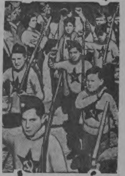
Мадрид'ульчавысь пионер'ёслэн отряды.