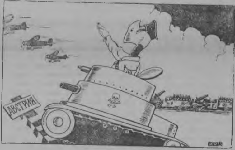
Фюрералэн „мирной“ визитэз