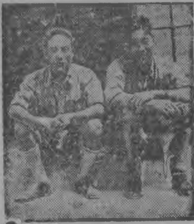
Китайской летчик'ес Хань-Гуань-хан (бурпалъэ) но МАС-ИН-ЦУ.