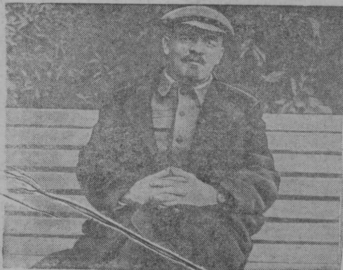
В. І. Ленин Горкын (1922 во.)

(Москва карса Сталинскӧј избїрателнӧј округса бӧрјысысјаслӧн предвыборнӧј собранїе вьлын речыс 1937-ӧд вӧса декабр 11-ӧд лунӧ Болшој театрын).