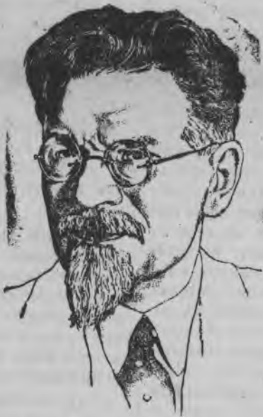
М. И. КАЛИНИН.

Калинин эшлэн славной юбилезлэн нуналэз Советской Союзысь калык'эс асьмелэсь кивалтысьсэ поздравлять каро но уно ар'эс чоже улыны желать каро асьме странаэн азыланын юнманэз понна, коммунизмлэн вормонэз понна нюр'ясыкыны.