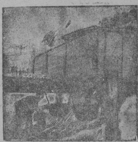
Пбжбны нбр кбрым

Колб пуктыны пом партијалыс вбш шујгавыв пбслбдблбмјаслы, сетны чорыд отпор налы, кодјас мблпалбны четчышты с-х артел вбмбн коммунал, кбр снб основнй мбгбн сулало колхозјасе артел формаон организација да кбжайственнй боксаон јонмодом