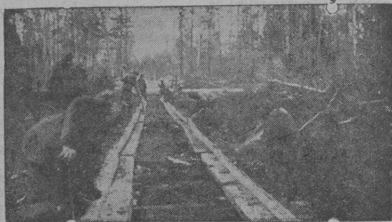
Вичин районн, Зимовјын, вӧчӧны лежневӧй туј.

4. Вӧрлежӧмын чорыд перелом вӧчӧм могыс, массӧвӧй политическӧй уж колхозјасын да сиктын организованныја уж вын вербујтӧм куза да массӧвӧја вӧрӧ петӧм организујтӧм куза нӧдӧны райкомјаслы да вӧрпромхозјаслы отсӧг сегом могыс, партијно-массӧвӧй да культурно-политическӧй уж пуктӧм могыс, сӧж-жӧ робочӧјасӧс лужика сквознӧй бригадасӧ организуйтӧм да вӧрпунктјас да бригадасјас хозрасщот вылӧ вужӧдӧмын отсӧг сегом могыс, — ОК-са агитмассотделлы колӧ сутки срокӧн мобилизујтны областувса да карса активыс 100 мортыс не ещӧдс да мӧдӧдны став рајоно ӧтӧ тӧлыс кежлӧ, ОК бјураса да ОКК пре- (пӧмсӧ виӧд 2 лист бока е).