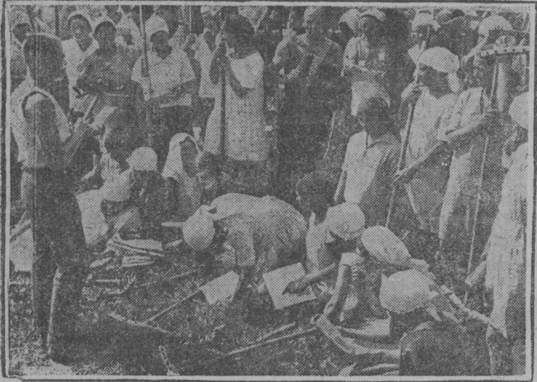
„Решающој 3-д во“ нима заюм разодом куза штурмујтан декада сиктын нуддигөн „Свободной труд“ нима колхоз (Клышевской с. совет, Роменской р. Мбска обл.) щощ вклучити тајо штурмујтан декадаас. Герпас вылын: бббдајтны петан кадб, колхозса јуралыс гижбалб колхозникјасбс заюм вылб.