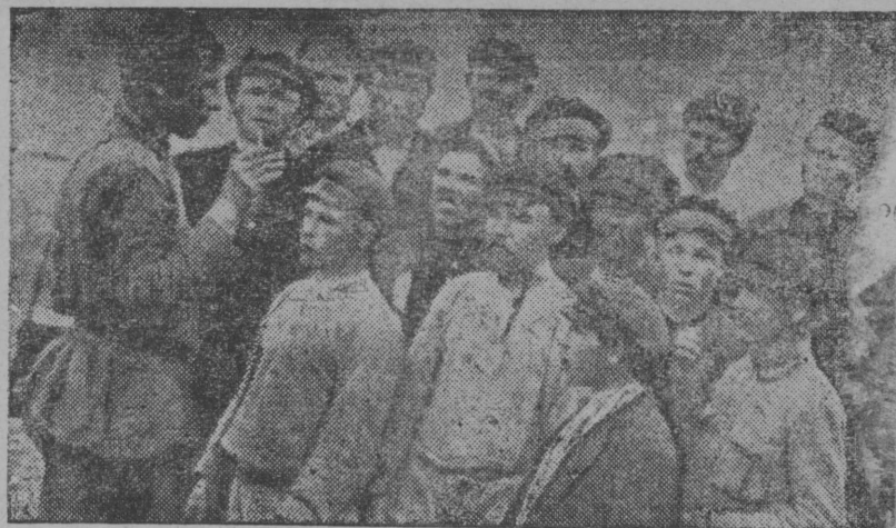
Серпас вылын: Ужјаса колхознөј бригада мај 21-д лунө, первојја лөтовка Сыктывкарө вайөдыөс.

нөјас, көні нүдөдны возвыө гїжсөм- јас выль зајом вылө да тајө-жө собранныө вылын нүдөдны подпіска. Робөчөјјас да служащ- өјјас собранныө вылын гїжсөсны „решајущөј кој- мөд во“ нима выль зајом вылө 2830 шайт дон да чук- салөны вөтчыны ас бөрсаныс Коми област паөтаыс став робөчөјјасөс, служащөјјасөс, колхозникјасөс, гөль да шөркөдөма крестьянаөс. Паскыда развернитны выль зајом лезын корөм куза быд прөізвод- ство вылын, колхозјасын да сплав вылын уж, онісан-жө нүдөданы предварителнөј подпіска выль за- јом вылө.