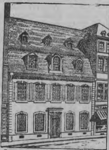
Трир городысь дом, кытын вёрдскиз Карл Маркс.

5 мае гениальной дышетислэн но мировой пролетариатлэн вождезлэн, научной коммунизмлэн основоположникезлэн Карл Марксезлэн вёрдскемез дырысен 120 ар тырмиз.