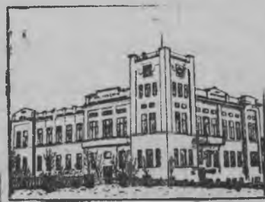
Чувашской АССР-ысь Чебоксары город. крестьянинлэн домез.