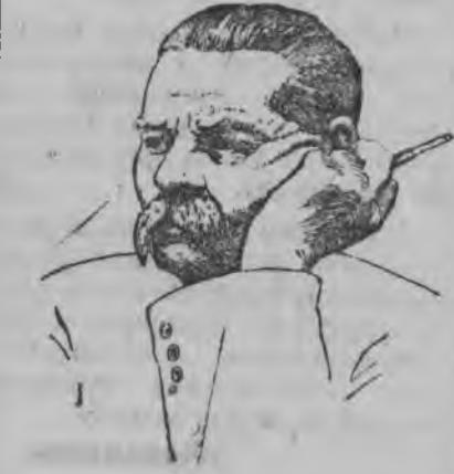
А. М. Горький (1868—1936 ар'ёсы)

Великой зуч писательлэн А. М. Горький (Пешковлэн) 1938 аре 28 мартэ вордскемез дырысен 70 ар тырмиз.