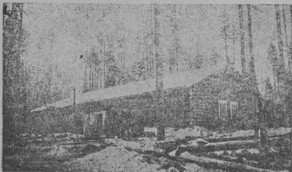
Бур керка Комилес обозса робочöjjаслы „Бөр-ju“ бокин