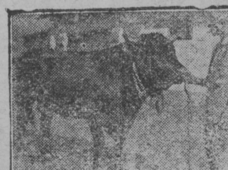
Серпас вьлын: Бaтумa рoбoчöй кo-опeрaтiв jöв фeрмaыс öш-Бунaј.