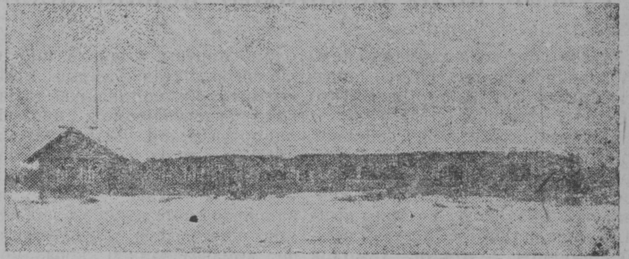
Читајевса коммуналөн выл керка

Партјачејкајас! бөстчөй коты-ртавын гөль группјас, чорчөдөй ку-лак вылө наступатөм паскөдөй массөвөй уж гөль да шөркөдө олысјас костын вөрлөзан да кол-хозстрөитан өд кыпөдөм могыс. Сө-мын тақїкөн вермам течны крепнө цөдув областын пјавїлетка ештө-дан вөб дорывы коллективізатсіја нуөдны да сы подулын кулакөс, кыч классөс бырөдны.