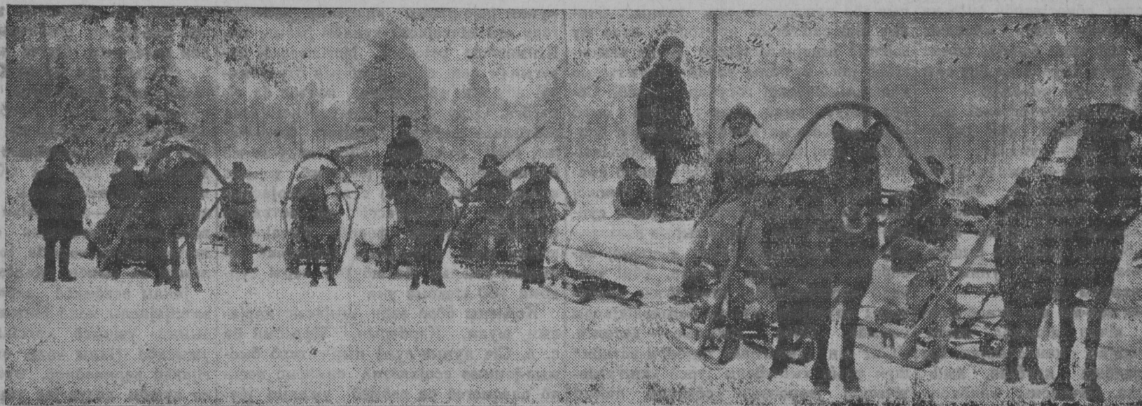
ВөрлезыҖаслөн новікса (Шојнаты рајон) артель.