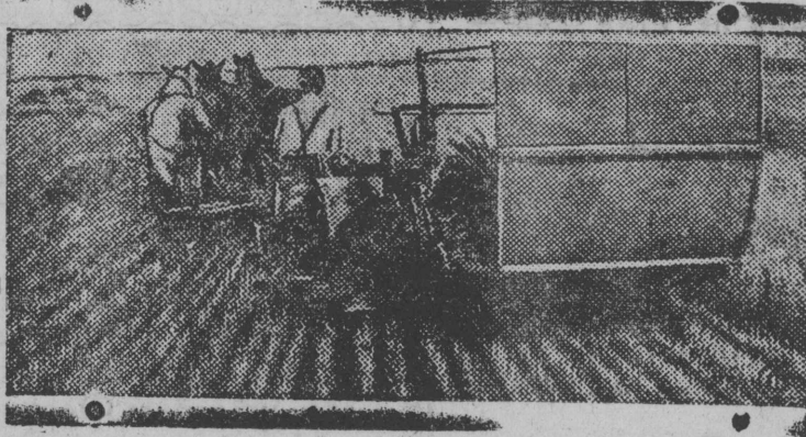
СҢМОК ВЛЫН: „Адбајтер“ колхозын (Крым), Шулац јорт машинаһн ышкө ид оу

Быд колхозлы колө босты прөмерсө лыатыса „12-өд октабр“ колхозлыс.