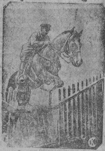
Снимок вылын орджыодын участник, кавалеріјскoј ескадрoнын боец—Свирін Јорт