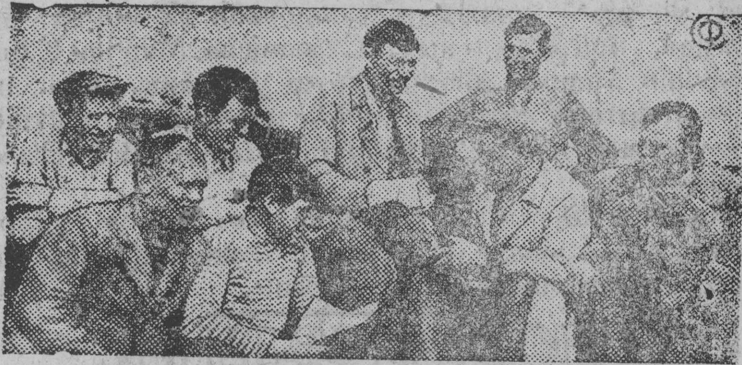
СНМОК ВЫЛЫН: Јамполској партїја рајкомса секретар Гор- лашов јорт (шбрас) нуодб перарывдырја полевылын „Активїст“ кол- хозса чвенјевбјјаскбд совещанїе.