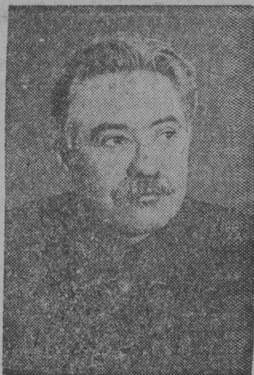
Снїмок вылын: Мануїлскї јорт.

ІККІ-ын ВКП(б) делегацијалбн уж јылыс ВКП(б) XVIII-бд сјезд вылын доклад вбчс—Мануїлскї јорт.