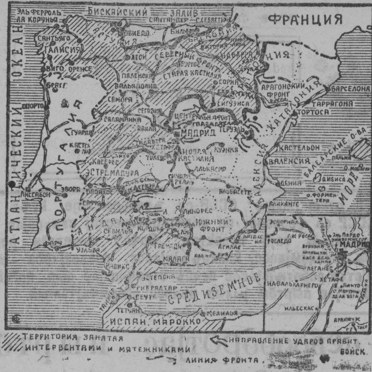
Схема фронтов в Испании.