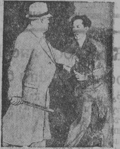
Полицейский избивает безоружного рабочего резиновой дубинкой.

Между засевшими в цехах рабочими завода „Виль Энд Туан“ в Детройте (штат Огайо) и вызванной администрацией полицией произошло кровавое столкновение. Много рабочих ранено.