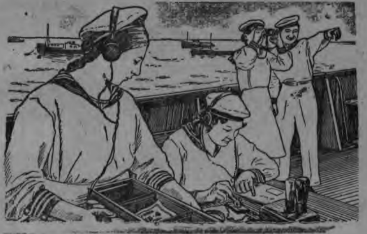
СЮРЕД ВЫЛЫН: радист'эс аппарат дорын.

Бакинской поргын „Пионер“ учебной судноын бакинской школасысь 120 дышетскись пинал'эс заниматься карыско. Пинал'эс моторист'эслэсь радист'эслэсь, сигнальщик'эслэсь квалификацизэс басьто.