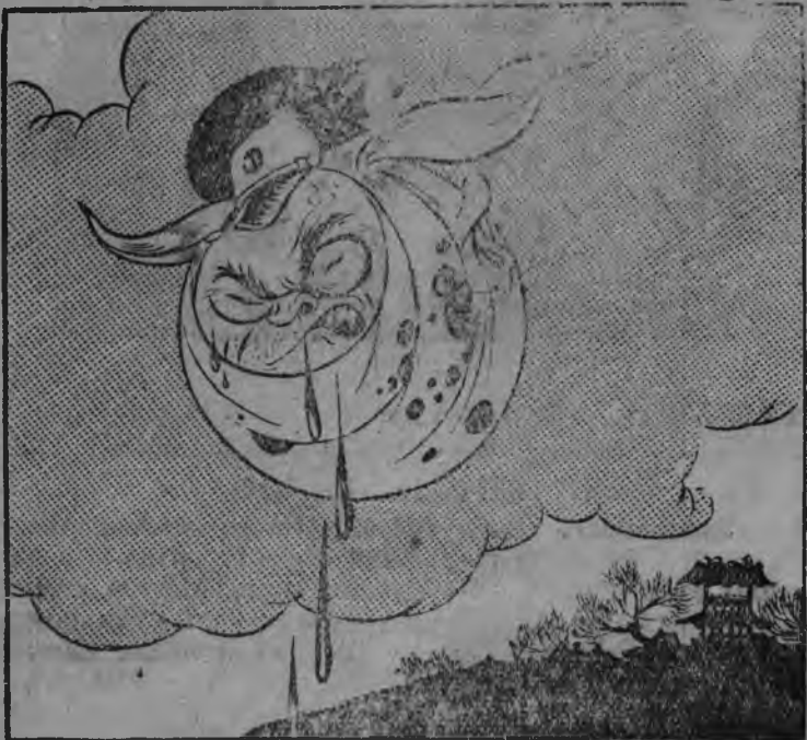
„Китайской горизо нтын 10 толэзь улэм бере.