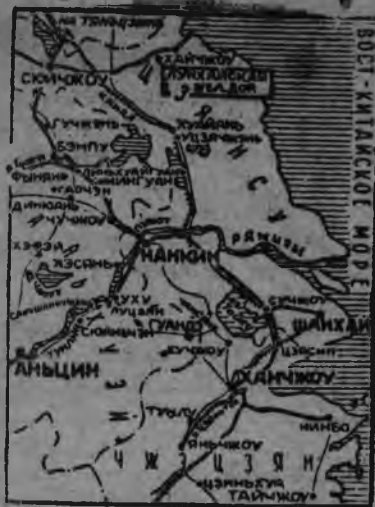
Центральной Китайлэн картаез.