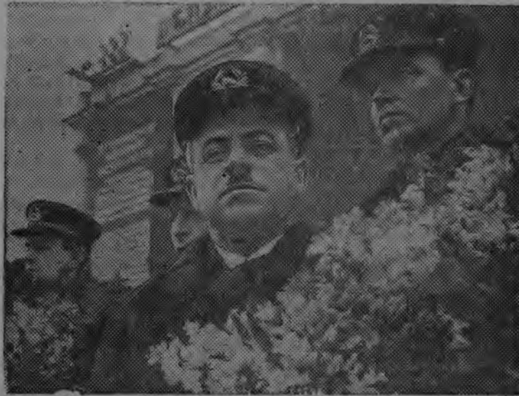
СУРЕД ВЪЛЫН: (паллянысен буре) Ширшов, Федоров, Папанин но Кренкель эш'ёс Комсомольской площадиын ортчем митинг дыр'я трибуна вылын.

Северный полюсэз победить карисьёс, социализм страналэн от-важной геройёсыз—Папанин, Ширшов, Кренкель но Федоров 1938 арын 17 мартэ Москвае вуизы.