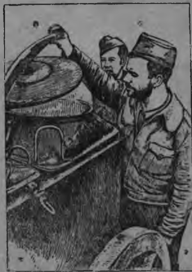
СУРЕД ВЪЛЫН: Республиканской частысь повар республиканской боец'ёслы сион дася.