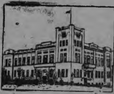
СУРЕД ВYЛЫН: Чувашской АССР-ысь Чебоксары городьсь Дом крестьянина.