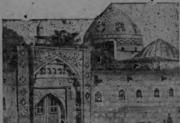
Ериванысь Исторической музей учкон азын. СУРЕД ВЫЛЫН: Исторической музей корка, татын экспонат'ёс чюкамын.