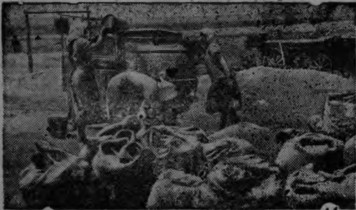
СУРЕД ВЪЛЫН: Ворошиловлэн нимыныз нима колхозысь (Одеской область, Спартаковской район) 2 №-ро бригада бусыны ю тысь шерты.