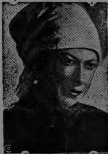
СУРЕД ВЫЛЫН: Н. К. Крупская крестьян дйсен (1917 ар).