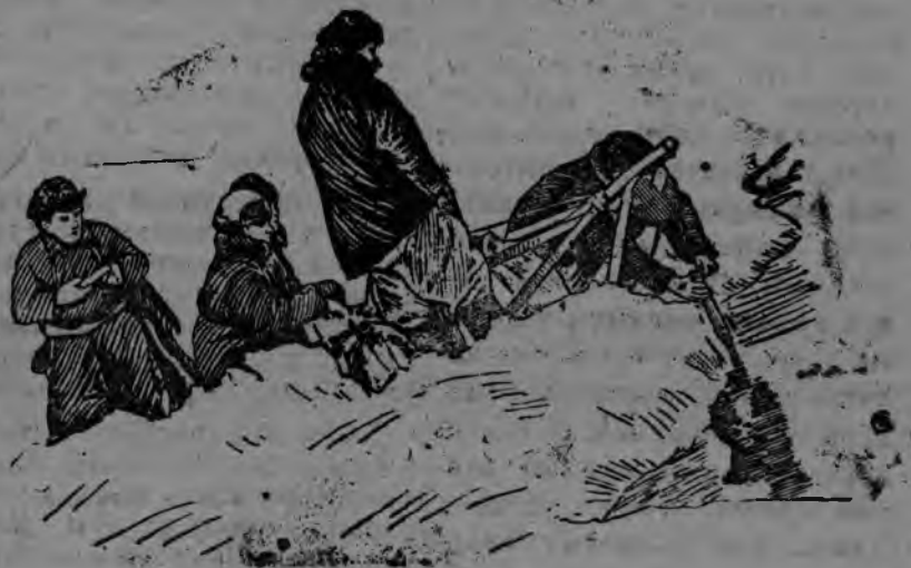
СУРЕД ВЪЛЫН: Экспедицилэн участник'ёсыз Северной полюсысь вуэз эскеро.