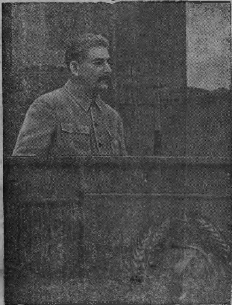
И. В. Сталин (Май 1941 аре)

Ленинградской, Прибалтийской особой, Западной особой, Киевской особой, Одесской, Харьковской, Орловской, Московской, Архангельской, Уральской, Сибирской, Приволжской, Северокавказской но Закавказской военной округ'ёсын военной обязаннойёсты мобилизовать карон сярсы