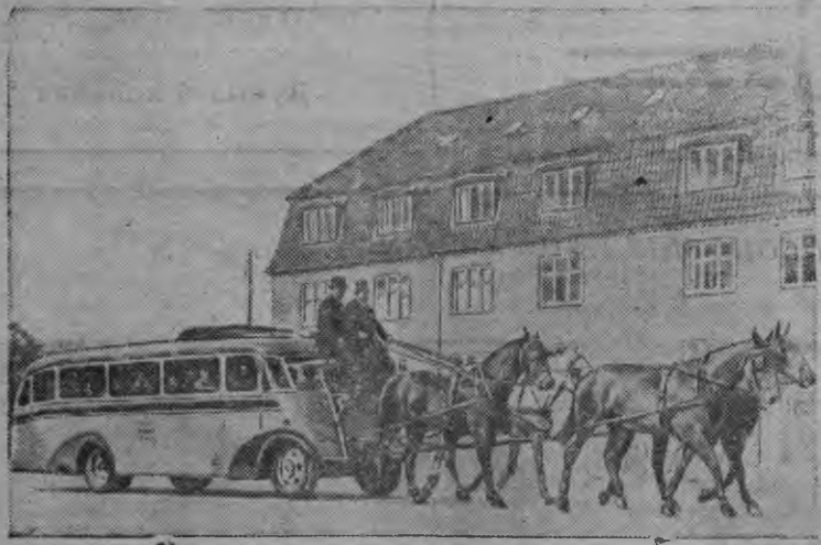
Суред вылын: Данилэн столичной городаз Копенгагенн автбуслэн движениез.

Даниын бензин окмымтээн автобус'эс валэн кыскыса нулл'ыско.