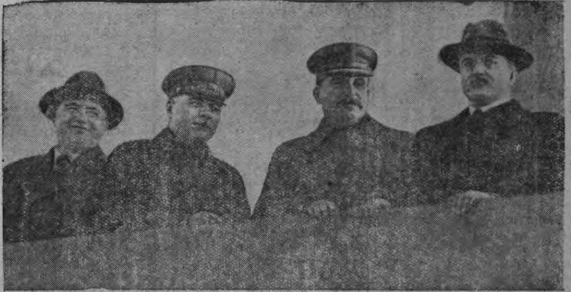
Бурисен палляне: В. М. Молотов, И. В. Сталин, К. Е. Ворошилов но Г. М. Дмитров мавзолейлэн трибуна вылаз.