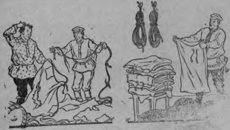
Отын, кытын кылынызы гивэ верало но чырты берэс кормало.

Оросово колхоз тулыс кизён азелы али но дас'тэвёл на (председателез Русских), нош Чумбер'яг колхоз туннэ потонно кад' дас' ни (председателез Фофанов)