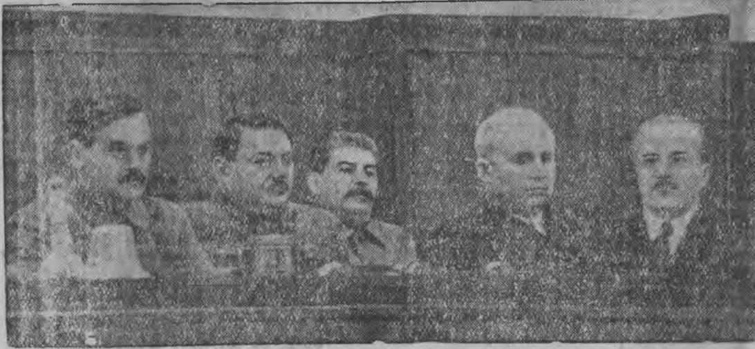
А. А. Андреев, А. А. Жданов, И. В. Сталин, Н. С. Хрушев но В. М. Молотов эш'ес конференцилэн президиумаз