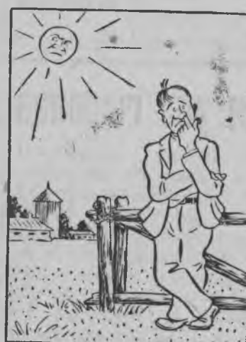
Мылкыд вань, шунды өвөл... Шунды вань, мылкыд өвөл...