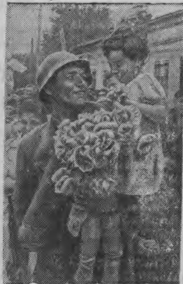
Пинал'ёс боец'ёслы сяськаос сётчало.

3 июле Кишинев городысь Александровской улицаын Бессарабиез мозмытонэн валче Красной Армилен парадэз но калык'ёслэн демонстрацизы ортчиз.