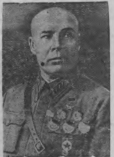
СССР-лэн Оборонаезлэн Народной Комиссарез, Советской Союзлэн Маршалэз Советской Союзлэн Героез С. К. Тимошенко

СССР-лэн Верховной Советэзлэн Президиумезлэн Указез'я Советской Союзлэн Героезлы 1-тй ранго командармы С. К. Тимошенколы присвоить каремын Советской Союзлэн Маршалэзлэсь званизэ. С. К. Тимошенко назначить каремын СССР-лэн Оборонаезлэн Народной Комиссареныз.