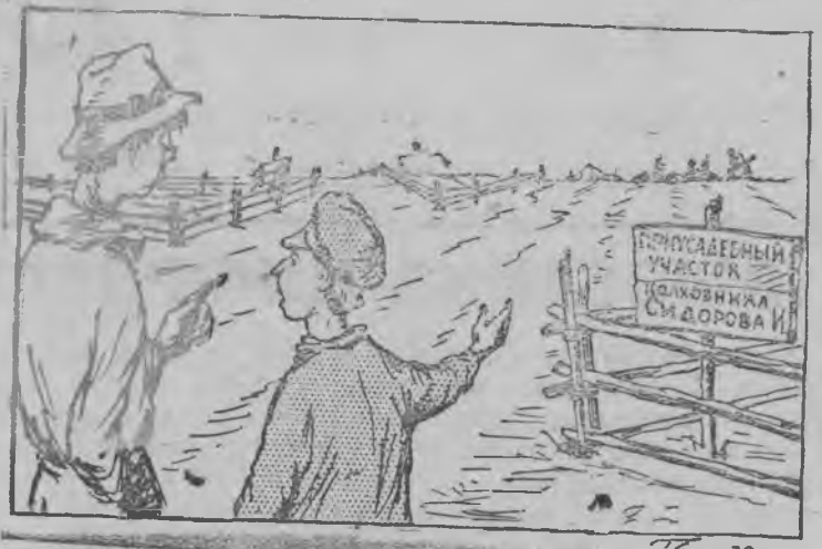
Приезжой: Марлы тйляд бакчаосты гурт дорысен туж кыдёкын? — А татын колхозлэн самой умой муз'емез...