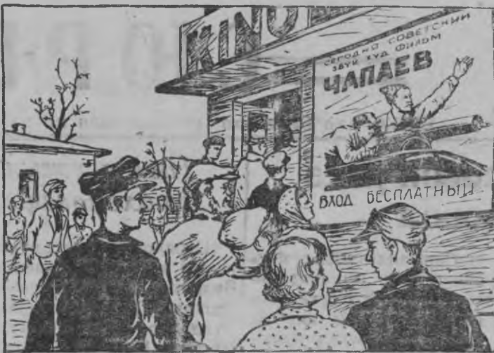
Чапаев массаез выльысь нюр'ясконэ жутэ