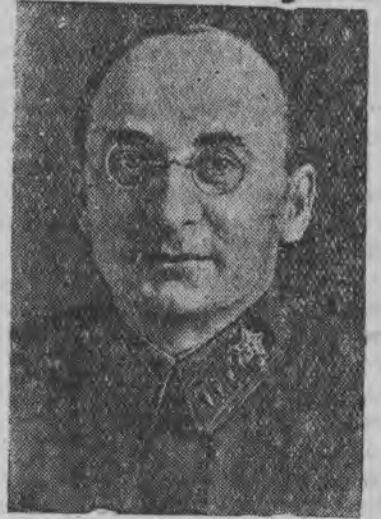
Суред вылын: Л. П. Берия эш.