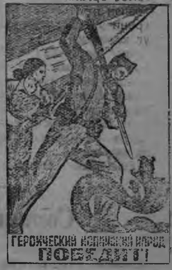
ГЕРОИЧЕСКИЙ КОПИЛАНЭН ИВРОД ПОБЕДИТ!

Удмуртилэн территорияез вылтй мыныса, свободной Удмуртекой калыкы лэсь привет ытйськом. В. Гризодубова, П. Осипенко, М. Раскова. Балезино станция, 26 октябре.