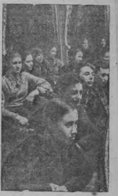
Дальничкой сел'советысь „Большевик“ сельхозартельсь колхозник'ёс театралэн залаз.

Опералэн но балетлэн Одесской государственной театраз 800-лэсь но трос Одесской Пригородной районьсь колхозник'ёс коллективно кылскизы „Иван Сусанин“ операез.