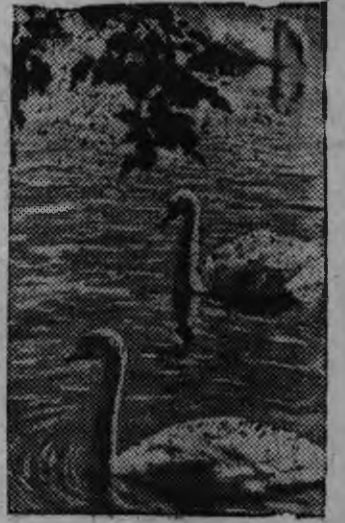
Суред вылын: Зоопарклэн прудаз юсьёс.