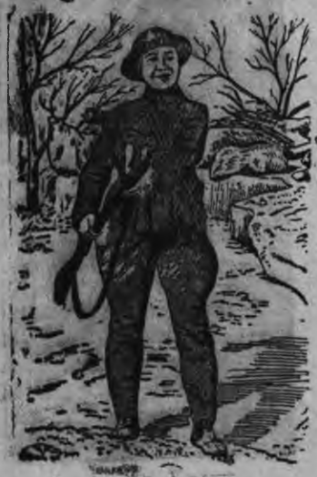
Суред вылын: Китайской нылкышно, армие добровольно поступить кариз.