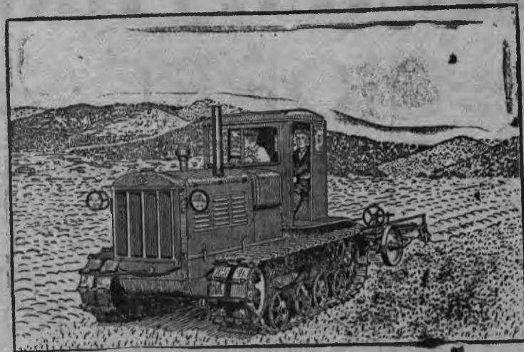
Суред вылын: СТЗ-НАТИ трактор Ворошилово колхозын (Судакской р-н, Крымской АССР) пар гыроньн.

Туэ арын Крымысь тросаз район'есын сельскохозяйственной уж'есын бад'зым азинсконэн СТЗ-НАТИ трактор'ес использоваться карисько. Гурезэ интйосын збк ужазинлык-сэ возматэ.