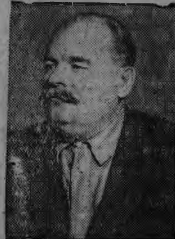
РСФСР-лэн Верховной Советэзлэн президиумезлэн председателез А. Е. БАДАЕВ эш.

УАССР-лэн Верховной Советэзлэн Сессиезлэн решениосыз Удмуртиысь калык'ёсты вооружить каро выль социалистической vormон'ёсты басьтон понна нюр'ясыконэ. Депутат'ёс ас уж бордазы бертыса, азыланьын но политической деятельлэн высотаяз луыса, Ленинлэн Сталинлэн партиезлэн ужез понна, калык'ёслэн интерес'ёсы понна жадёнзэс тодытэк ужалозы.