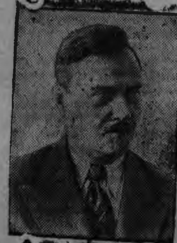
РСФСР-ысь Народной Комиссар'ёсылэн Советсылэн председателез Н. А. БУЛГАНИН.