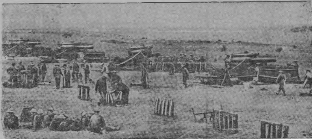
Англилэн юг пал ярдуроз артиллерийской укрепленос.