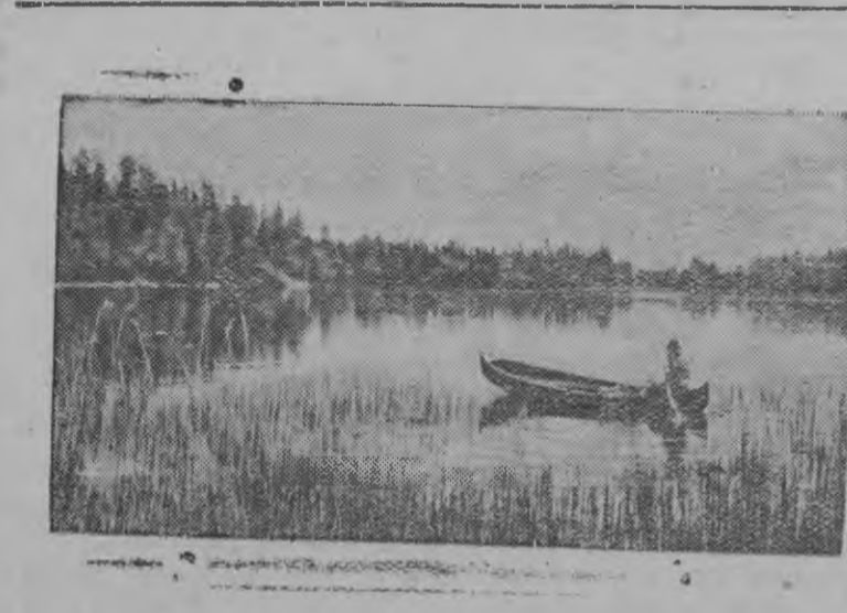
Карело-Финской пейзаж (снять каремын Кевсгол'ым дорысен 11 километр кемын)