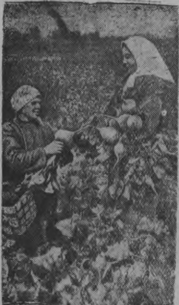
Бакча емыш'ёсты октон.

Нью Йорк, 24 августэ. (ТАСС). Ассошиэйтед пресс агенстволэн бомбейской корреспондентэзлэн ивортэмез'я, Индийской национальной конгресслэн исполкомезлэн бюроез добровольческой организациослэсь ужанэс дугдытон сырысь английской властьёслэсь кэсон'ёссэс ултйяса, со добровольческой организациослы ас ужзэ азьлань нуыны косйз.