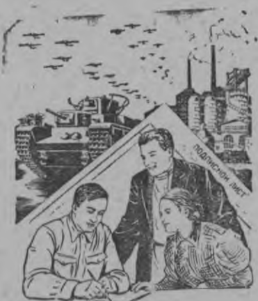
ПОДПИСКОЙ НА ЗАЕМ МЫ УКРЕПЛЯЕМ МОГУЩЕСТВО НАШЕЙ РОДИНЫ.

В. Барковлэн но В. Лисевичлэн рисуноксы.