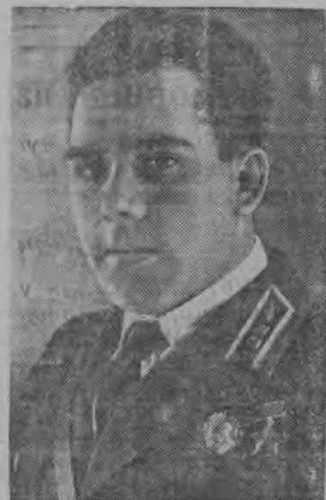
Советской Союзлэн Героез Александр Григорьевич Плотников (азыло Челябинской Областысь колхозник).

Финской белогвардейщины юр'ясыкон фронтын кудованилэсь боевой зада образцово быдэстэмез понно со дыр'я отвагазэ но роивозез возматэмэз поллейтенантлы А. Г. Плотниковлы. Советский Союзлэн Героезлэсь званизэ присвоить каремын.