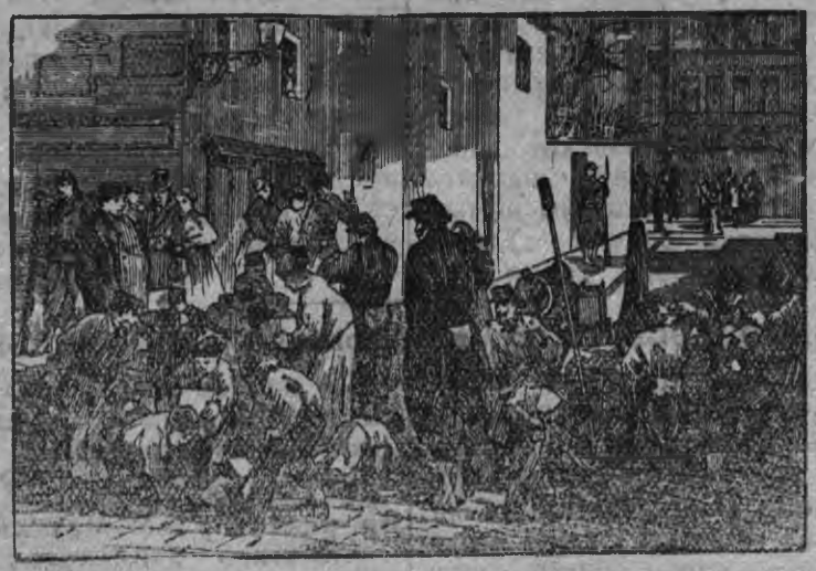
Суред вылын: Коммунар'ёс Парижлэн одйгаз улъяяз баррикада лэсты.

1922 яны Советской Союзын МОПР организация кылдытське. Со Парижской Коммуналысь геройёсылы, Парижской палачёслэн ки улазы шедем жертвоосылы посвятит карыса кылдытэмын вал, кудыз 18-тй мартэ МОПР-лэн нуналызы объявиться карыськиз, МОПР зарубежной пролетариат'ёслы Парижской Коммуналысь нуналэз азелы.