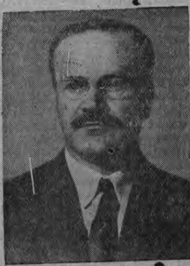
В. М. Молотов эш

Международной положениез характеризовать карыса, Сталин эш соку подчеркнуть кариз, что уж явным образом мынэ виль имериалистической войнае.