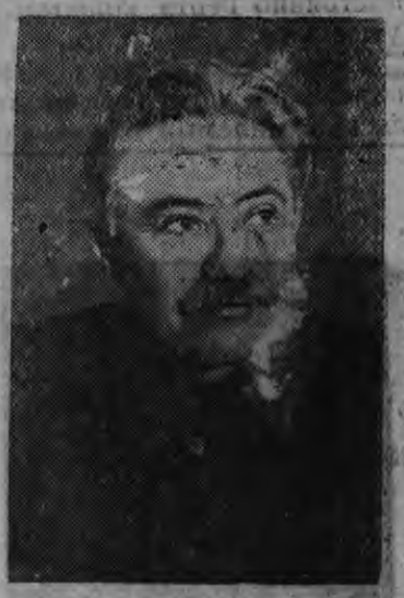
Д. З. Мануильский эш

Сталин эш Марксэсь—Энгельсэсь—Ленинэсь ученизэс вражеской элемент'ё-